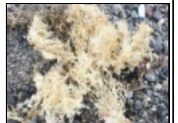
真水洗い⇄乾燥を繰り返して飴色に