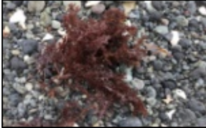
波で打ち寄せられたテングサ

「浜の子の天草拾いは、山の子の椎の実拾いと違って、理屈より五感で覚えるのだろう。」