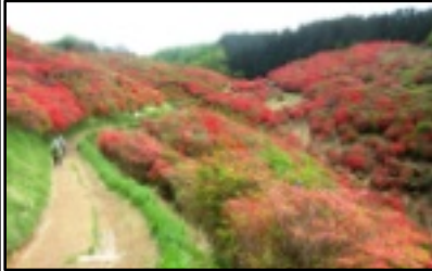
山道の両側を見上げながら

は一旦山上へ登らないと拝めず、山上へは近鉄のロープウェイがある。山麓駅横から歩いて登る人も結構いたが、勿論我々にはそんな元気はない。オンシーズンは10時を過ぎると山麓駅に至る道路は駐車場へ入る車で行列ができ、山麓駅前にもまた人の行列ができる、というほどの人気。我々はそれを見越して9時頃までには到着していたので混み具合もまずまずだった。ロープウェイ代往復二千二百五十円也。高ア！近鉄さんのツツジ特需やね。