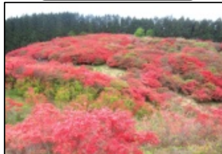
山の斜面は真っ赤です

は一旦山上へ登らないと拝めず、山上へは近鉄のロープウェイがある。山麓駅横から歩いて登る人も結構いたが、勿論我々にはそんな元気はない。オンシーズンは10時を過ぎると山麓駅に至る道路は駐車場へ入る車で行列ができ、山麓駅前にもまた人の行列ができる、というほどの人気。我々はそれを見越して9時頃までには到着していたので混み具合もまずまずだった。ロープウェイ代往復二千二百五十円也。高ア！近鉄さんのツツジ特需やね。