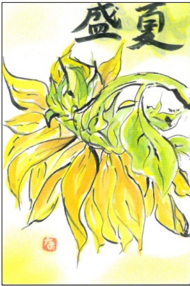
絵手紙 (松井 なほ子)