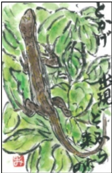
絵手紙 (杉江 みよ子)