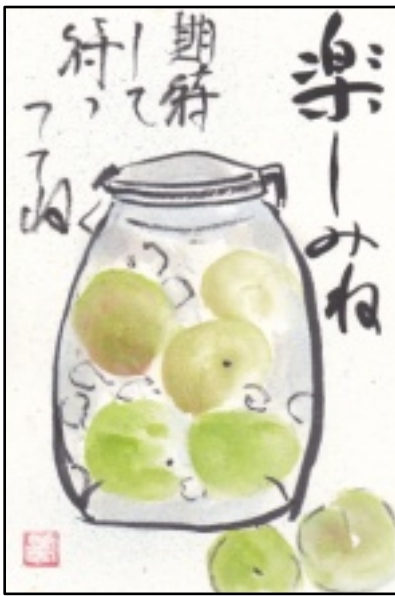
絵手紙 (藤井 美智子)