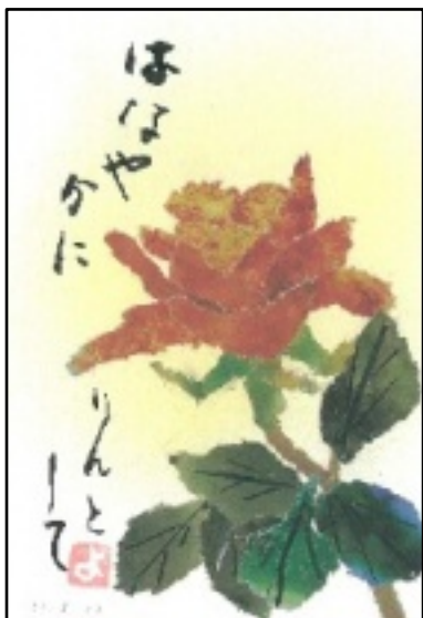
水きり絵 (長谷川 洋子)