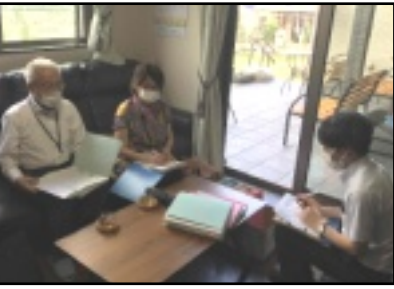
福祉施設管理者へのインタビュー風景

研修を通じて、保育園・高齢者や障がい者施設、認知症のグループホームの他に、児童養護施設・乳児院等の社会的養護施設が数多くあることを知り、