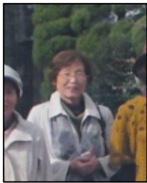
俳句同好会の吟行にて