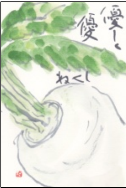
絵手紙 (島村 多恵子)