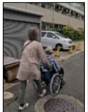
車椅子活動中の 筆者

身仕事も縮小し、何か新しいことを始めたいな、と思っていた頃、ふと彼女から聞いていたナルクのことを思い出し、おもいきり入会させてもらったのです。ある日突然運営委員になってほしい、と言われた時は少しばかり迷いました。でも、今のままだら終わってしまおうの感じはないかと考え、おもいきりお引き受けしました。賛成も反対もありませんでした。現在の、預託時間活動として、不自由な男性のお買い物支援サービスも、入居しておられる身体ごせでもらっていただきます。車椅子やスーパースーツ、飲み物や衣類や本など、欲しいものはおつしやるものを買って帰ります。LL(エール)のヘルパーの大きな関係で、車椅子の操作には慣れていません。ジャナルクの初級教室には興味も健康もありません。どうぞ宜しくお願い申し上げます。