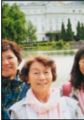
お孫さんの結婚式時 ドイツにて

〒542-0012 大阪府中央区谷町6-4-8 新空堀ビル2階206-2 TEL/FAX 06-6710-4522 EM: ichou@nalc-osaka.com HP: http://www.nalc-osaka.com