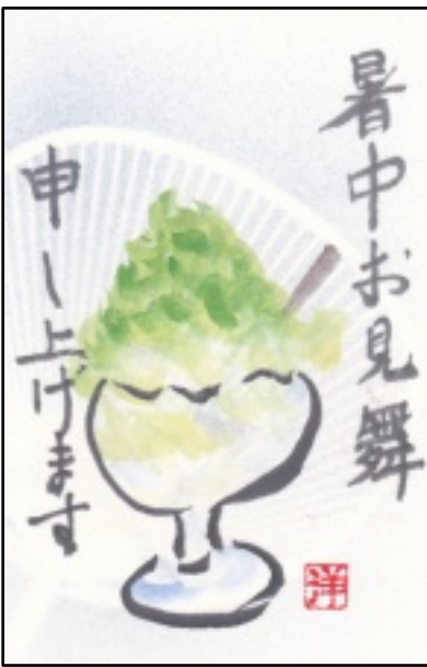
絵手紙 (萩原 洋子)