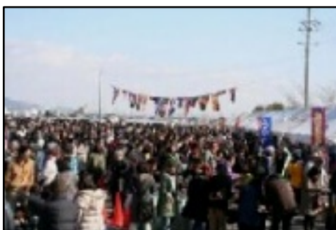
大勢の客で賑わう 室津かき祭り