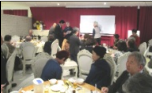
ビンゴゲーム。リーチで立ちます。