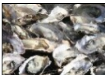
美味しい焼き立ての牡蠣

綾部山梅林も有名です。5月には新舞子浜で潮干狩りも楽しめます。おすすめコースです!