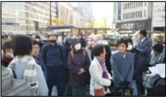
時間厳守の日本銀行なので、早めに集合。ワクワクしながら時間待ち。

度移転し、明治十五年に旧東区今橋(現在の大阪俱樂部)に開設されました。明治十七年に旧東区大川町(現在の三井住友銀行の場所)に移転、経済の発展と共に支店の事務量が増えて、明治三十六年に中之島に移転しました。