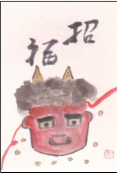
絵手紙 (長谷川 洋子)