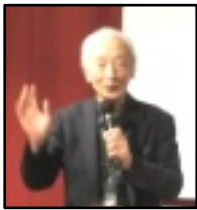
寺井副会長 一本締め