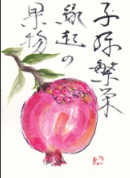
絵手紙 (藤井 美智子)