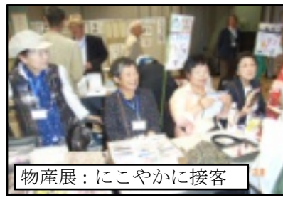
物産展：にこやかに接客