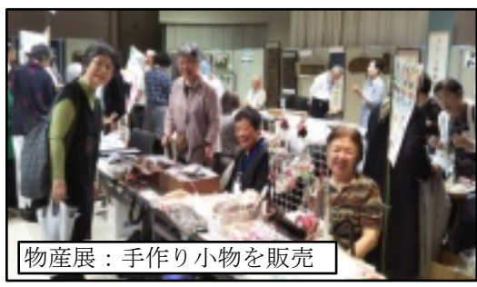
物産展：手作り小物を販売