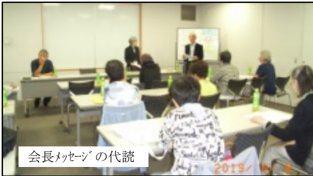
会長メッセージの代読