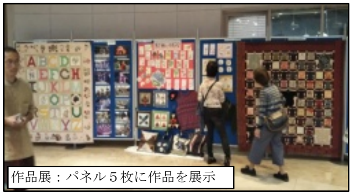
作品展：パネル5枚に作品を展示