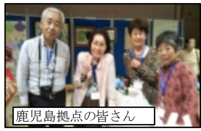
鹿児島拠点の皆さん