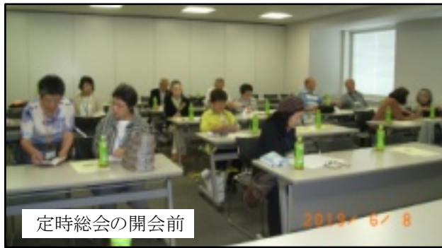
定時総会の開会前