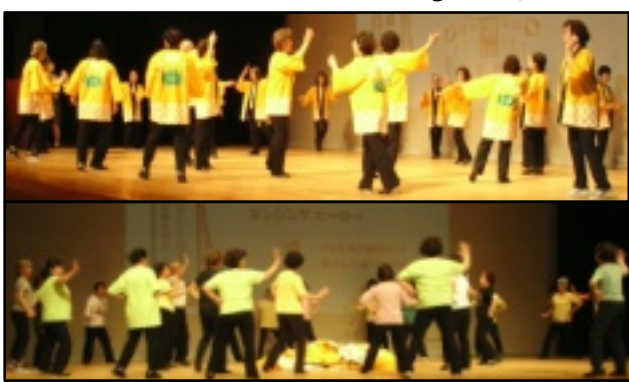
大阪連合：河内音頭(上)、ダンシングヒーロー(下)